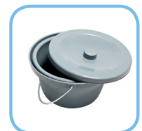
Eimer mit Deckel