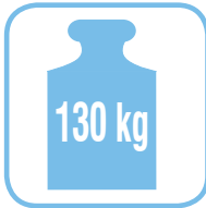
Belastbarkeit 130 kg