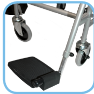
stufenlos einstellbare Fußstütze