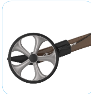
Wartungsfreie Bremsen und TPE-beschichtete bruchfest Räder.