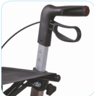
Stufenlos höhenverstellbare Griffe und feststellbare Handbremsen.

Die Handgriffe lassen sich leicht einstellen in einem Bereich von 63-102 cm