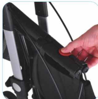
Zusammengeklappt bleibt stabil