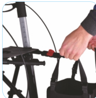
Praktische abnehmbare Einkaufstasche